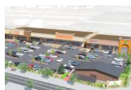
フォレストモール佐久平