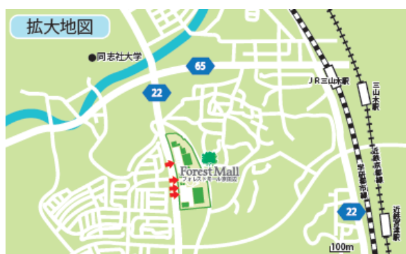
JR 三山木駅より徒歩約22分

使用料 平日：16,500円/日 (税込) 土日祝：33,000円/日 電源 有り