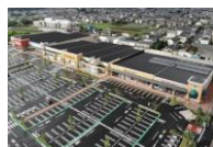
フォレストモール石岡